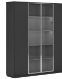
КОМПОНОВКА 1 / ЧЕРНЫЙ МАТОВЫЙ Ш: 184 / Г: 42 / В: 232 СТЕЛЛАЖ ОДНОСЕКЦИОННЫЙ (EMR 431) - 2 ШТ. СТЕЛЛАЖ ДВУХСЕКЦИОННЫЙ (EMR 432) - 1 ШТ. ДЕКОРАТИВНЫЕ БОКОВИНЫ (SJT 470) - 1 ШТ. ДЕКОРАТИВНЫЙ ТОП И ЦОКОЛЬ (SJT 472) - 1 ШТ. ДВЕРКИ БОЛЬШИЕ СТЕКЛЯННЫЙ В AL-РАМЕ (SJT 503) - 2 ШТ. ДВЕРКИ БОЛЬШИЕ ГЛУХИЕ (SJT 504) - 2 ШТ.