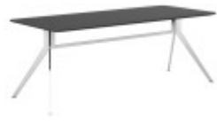
СТОЛ ПРЯМОЙ (SJT 101) Ш: 180 / Г: 90 / В: 74 (SJT 102) Ш: 200 / Г: 90 / В: 74