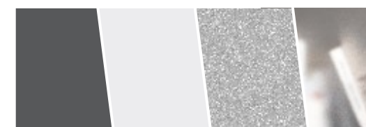
СТОЛЕШНИЦА, ФАСАД: ЧЕРНЫЙ МАТОВЫЙ КОРПУС: БЕЛЫЙ ЛДСП ОПОРЫ: ХРОМ СТЕКЛО: МАТОВОЕ