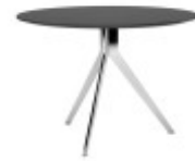
СТОЛ ПЕРЕГОВОРОВ (SJT 702) Ø: 110 / В: 74