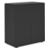
ШКАФ НИЗКИЙ (SJT 401) Ш: 82 / Г: 42,2 / В: 90