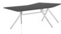
СТОЛ ИЗОГНУТЫЙ (SJT 121) Ш: 228 / Г: 130 / В: 74