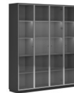
КОМПОНОВКА 2 / ЧЕРНЫЙ МАТОВЫЙ Ш: 184 / Г: 42 / В: 232 СТЕЛЛАЖ ОДНОСЕКЦИОННЫЙ (EMR 431) - 2 ШТ. СТЕЛЛАЖ ДВУХСЕКЦИОННЫЙ (EMR 432) - 1 ШТ. ДЕКОРАТИВНЫЕ БОКОВИНЫ (SJT 470) - 1 ШТ. ДЕКОРАТИВНЫЙ ТОП И ЦОКОЛЬ (SJT 472) - 1 ШТ. ДВЕРКИ БОЛЬШИЕ СТЕКЛЯННЫЙ В AL-РАМЕ (SJT 503) - 4 ШТ.