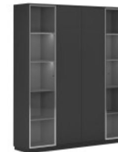
КОМПОНОВКА 3 / ЧЕРНЫЙ МАТОВЫЙ Ш: 184 / Г: 42 / В: 232 СТЕЛЛАЖ ОДНОСЕКЦИОННЫЙ (EMR 431) - 2 ШТ. СТЕЛЛАЖ ДВУХСЕКЦИОННЫЙ (EMR 432) - 1 ШТ. ДЕКОРАТИВНЫЕ БОКОВИНЫ (SJT 470) - 1 ШТ. ДЕКОРАТИВНЫЙ ТОП И ЦОКОЛЬ (SJT 472) - 1 ШТ. ДВЕРКИ БОЛЬШИЕ СТЕКЛЯННЫЙ В AL-РАМЕ (SJT 503) - 2 ШТ. ДВЕРКИ БОЛЬШИЕ ГЛУХИЕ (SJT 504) - 2 ШТ.