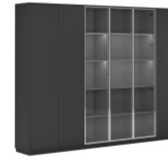
КОМПОНОВКА 4 / ЧЕРНЫЙ МАТОВЫЙ Ш: 274 / Г: 42 / В: 232 СТЕЛЛАЖ ОДНОСЕКЦИОННЫЙ (EMR 431) - 2 ШТ. СТЕЛЛАЖ ДВУХСЕКЦИОННЫЙ (EMR 432) - 2 ШТ. ДЕКОРАТИВНЫЕ БОКОВИНЫ (SJT 470) - 1 ШТ. ДЕКОРАТИВНЫЙ ТОП И ЦОКОЛЬ (SJT 473) - 1 ШТ. ДВЕРКИ БОЛЬШИЕ СТЕКЛЯННЫЙ В AL-РАМЕ (SJT 503) - 3 ШТ. ДВЕРКИ БОЛЬШИЕ ГЛУХИЕ (SJT 504) - 3 ШТ.