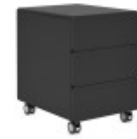
ТУМБА МОБИЛЬНАЯ (SJT 301) Ш: 44 / Г: 55,7 / В: 58